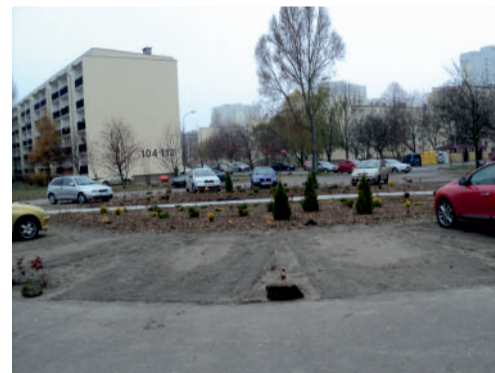
Parking na os. Oświecenia

budynkach 15-18 oraz wykonało, jakże potrzebne, obniżenie krawężników na 35 przejściach dla pieszych. Powstało także 15 nowych miejsc parkingowych na os. Oświecenia u szczytu bloku 104 -112.