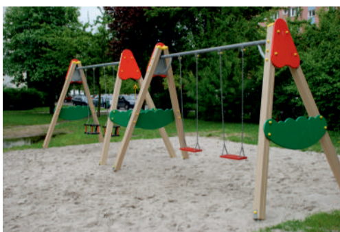
Plac zabaw na osiedlu Piastowskim