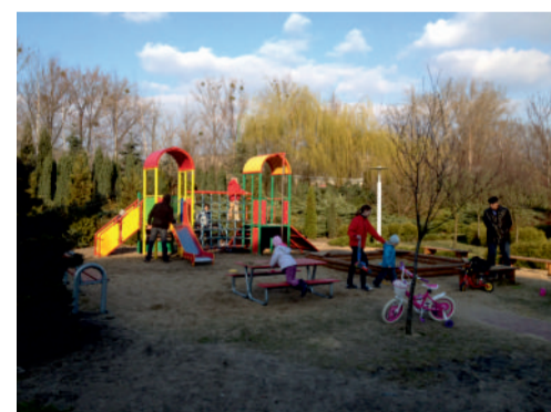
Nowy plac zabaw na Os. Zielony Taras

współfinansowana w połowie przez tutejsze Wspólnoty Mieszkańcze jest pierwszą częścią unowocześnienia rekreacyjnej części tego młodego osiedla. W planie są upragnione przez dzieci huśtawki i bujaki,