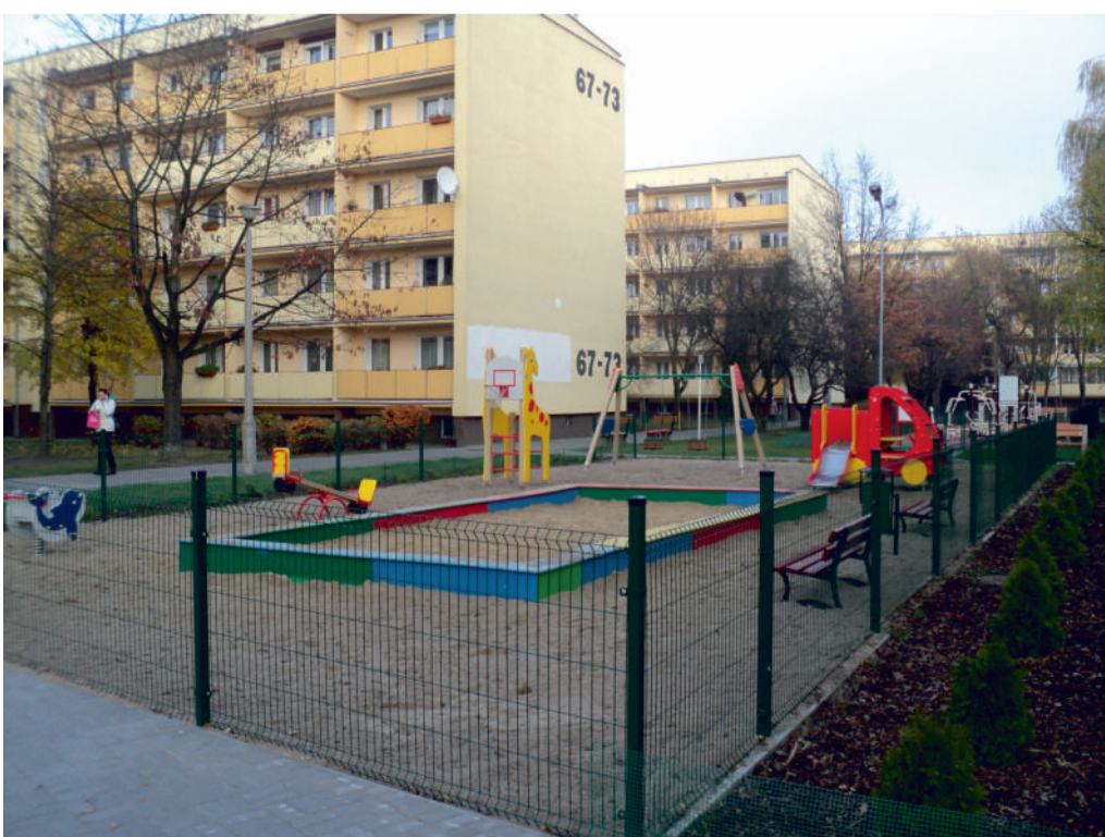
Plac zabaw na os. Bohaterów II Wojny Światowej

Tekst - Marek Dojs Współpraca-- Grzegorz Marciniak