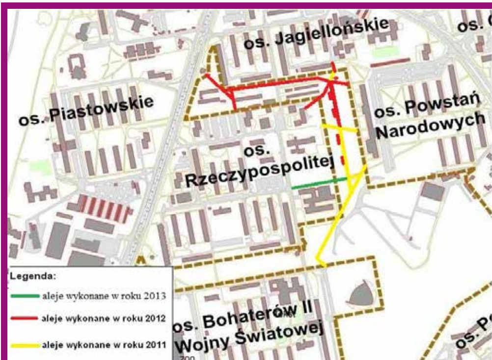
Aleje powstałe w latach 2011-2013