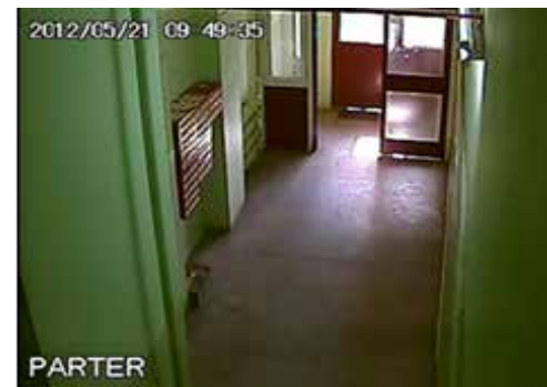
Widok z kamer monitoringu

Ale to nie wszystko. Dzisiaj możliwości techniczne są o wiele większe w wykorzystaniu