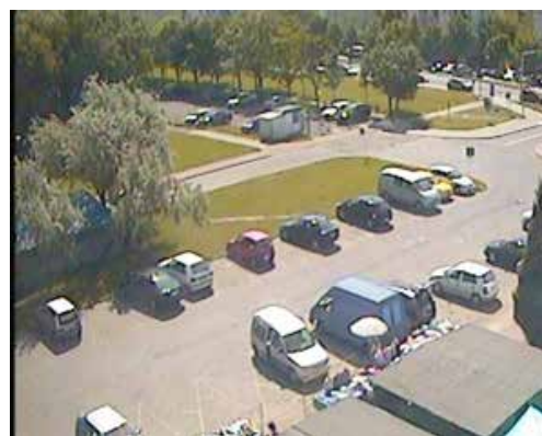
Widok z kamer monitoringu

Projekty monitoringu na Ratajach są już opracowywane na poszczególnych osiedlach ratajskich, między innymi na osiedlu Rusa.