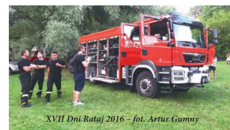
XVII Dni Rataj 2016