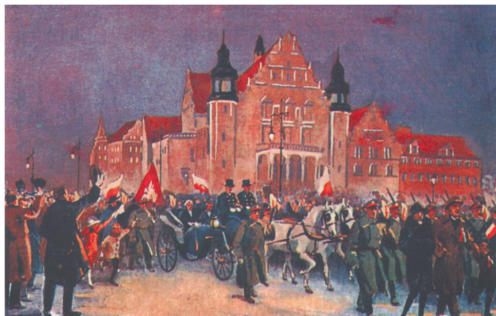
Przyjazd Ignacego Paderewskiego

hiszpance (...). Ze strony polskiej zrazu nie odpowiadano, usiłowano dojść do jakiegoś porozumienia i uniknąć krwi rozlewu. Gdy jednak strzały nie ustawały, gdy szereg osób odniosło rany, Straż Ludowa poczęła odpowiadać na strzały i zarządziła środki bezpieczeństwa mające chronić przechodniów (...)” „Kurier Poznański” nr 298 z 29 XII 1918 r.