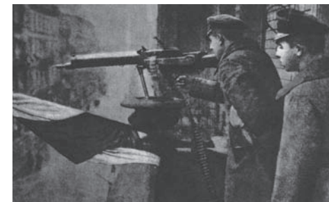
Stanowisko karabinu maszynowego na jednym z balkonów u zbiegu ulic Szkolnej i Podgórznej

31 grudnia 1918 – Wyzwoliły się: Ostrów, Oborniki, Kościan, a w dniach poprzednich między innymi: Śrem, Wągrowiec, Wronki. Początek polskiej ofensywy z Gniezna pod dowództwem Pawła Cymy w kierunku Kujaw.