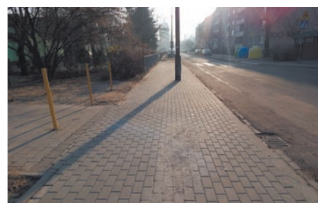
Os. Rzeczypospolitej (przy X LO) po.