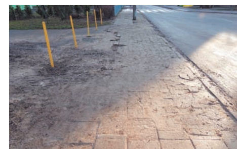
Os. Rzeczypospolitej (przy X LO) przed.