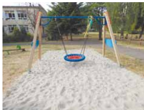
Przedszkole nr 113

nież 10 tys. zł , i był to kolejny etap prac związany z poprawą infrastruktury ogrodowej. Natomiast drugi odbiór odbył się w Przedszkolu nr 126, w którym została odmalowana sala rytmiczna wraz z cykli-