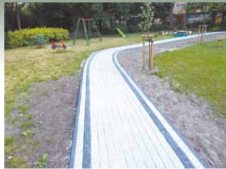
Przedszkole nr 117

nież 10 tys. zł , i był to kolejny etap prac związany z poprawą infrastruktury ogrodowej. Natomiast drugi odbiór odbył się w Przedszkolu nr 126, w którym została odmalowana sala rytmiczna wraz z cykli-