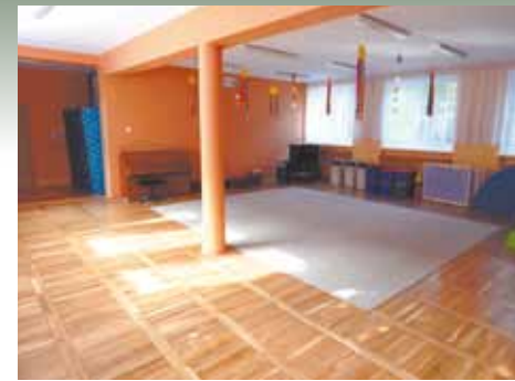
Przedszkole nr 126

nowaniem parkietów. Całkowity koszt wyniósł 20 tys. zł i został zrealizowany z tzw. środków celowych, które są w dyspozycji Rady Osiedla. Dodatkowo w Przedszkolu nr 126 zaplanowano w tym roku remont chodnika w ogrodzie przedszkola na który Rada Osiedla Rataje przeznaczyła 10 tys. zł oraz zakup osłony przeciwsłonecznej nad piaskownicą na kwotę 3 tys. zł . Łączna kwota przeznaczona na remonty w przedszkolach i szkołach podstawowych na rok 2018 wynosi 496,018 zł, z czego kwota 188,750 zł została ujęta w planie wydatków Osiedla Rataje. Reszta to środki celowe. Ciekawa inwestycja została zrealizowana w Przedszkolu nr 113 na os. Rzeczypospolitej. W ogrodzie przedszkolnym