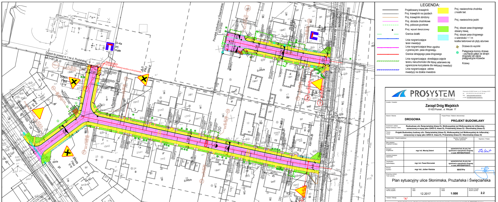
ul. Słonimskiej, Prużańskiej i Święciańskiej